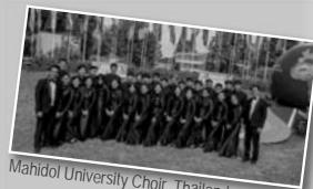
Mahidol University Choir, Thailand

mit Mahidol University Choir, Thailand Kammerchor Hogo Wolf, Slowenien Main Stream Magic Erlenbach