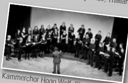
Kammerchor Hogo Wolf, Slowenien