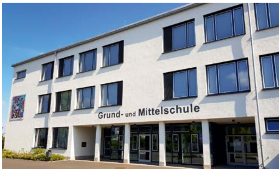
Die Grund- und Mittelschule in Wörth verfügt – wie alle anderen Schulen im Mainbogen – seit Anfang des Schuljahrs über einen schnellen Glasfaseranschluss. Eine Point-to-Point-Verbindung sorgt dafür, dass sich die Schule die Bandbreite mit niemandem teilen muss.

Mehr Infos: (09372) 9455-43 und -35, E-Mail: dsl@ezv-energie.de , www.echtzeitverbindung.de