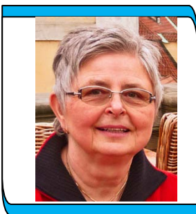
Gabriele Bonn Strickkreis 09372 / 944744