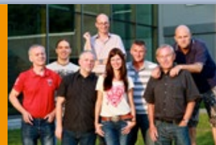
Die GRAUEN PANTHER