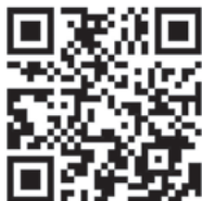
Umfrage 10 – 14 Jahre