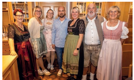
Das Team vom Bachgauer Hof erhielt viel Lob und Anerkennung